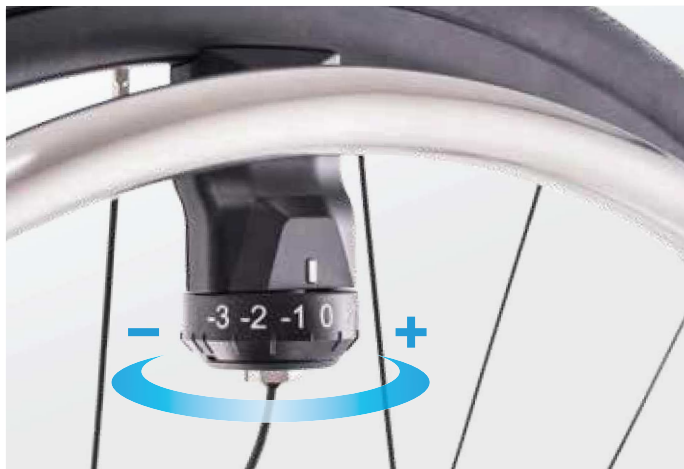
Empfindlichkeit der Fahrsensoren in sieben Stufen einstellbar

Der e-motion ist flexibel: Er ist mit den verschiedensten Rollstuhlmodellen kompatibel und kann an deine individuellen Bedürfnisse angepasst werden. Die Schubkraft-Unterstützung lässt sich an beiden Antriebsrädern unabhängig voneinander einstellen. Mehr oder weniger Kraft in einem Arm ist also kein Problem. Dein Fachhändler oder Therapeut hat zusätzlich die Möglichkeit, weitere Einstellungen an deinem e-motion vorzunehmen, so dass er optimal auf deine Fahrweise abgestimmt ist. Der e-motion ist in drei Radgrößen verfügbar und kann auf Wunsch mit ergonomischen Greifreifen ausgestattet werden. Das sorgt für optimalen Grip in jeder Fahrsituation.