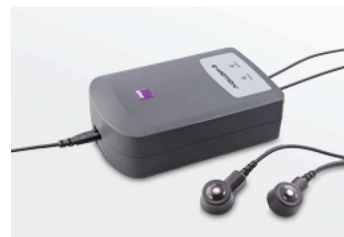
Automatik-Ladegerät: Passt sich automatisch an die Netzspannung an und lädt beide e-motion Akkus in wenigen Stunden (im Lieferumfang enthalten)