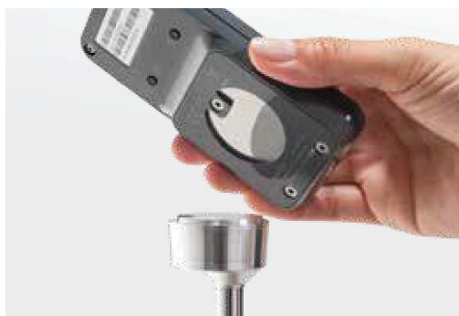
Magnethalterung für ECS-Fernbedienung zur Montage am Rollstuhl (Zubehör)